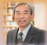
清水 憲二 教授